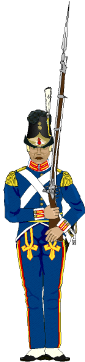
Leib-Regiment Brigade Grenadierkorps 1813

Seit dem 25. September standen somit erstmalig schwedische Truppen in vorderster Linie, wo sich die Möglichkeit bot, in schwerere Kampfhandlungen verwickelt zu werden. Man kann sich die Unruhe Carl Johans sicher vorstellen!